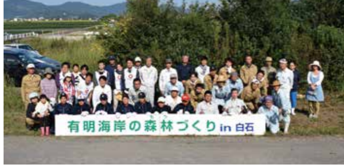
■ ボランティア参加者の皆さん

参加者の皆さんありがとうございました。また、育樹活動は今後も定期的に行われますので、ご協力をお願いします。