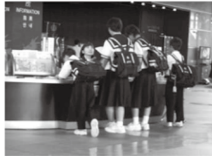
九州国立博物館での校外学習