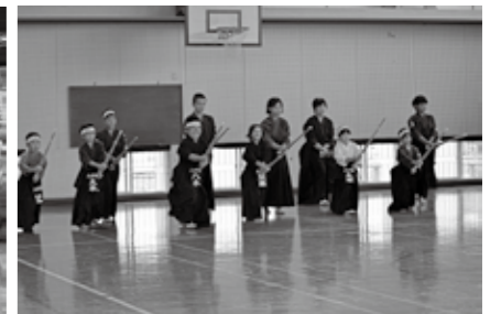
■剣道の奉納は六角小体育館で行われました

ブから演武と奉納試合が納められました。前日まで雨が心配されていましたが、神事や奉納の最中は雨が降ることもなく、境内は太鼓や笛の音が鳴り響き晴れやかな雰囲気になっていました。