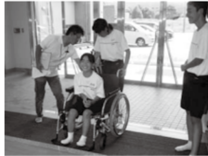
社会福祉協議会による福祉体験