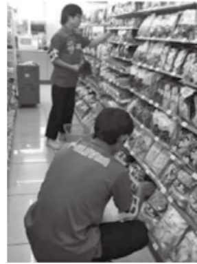
職場体験のようす