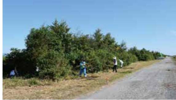
■ 樹木周りがスッキリとなっけていきます