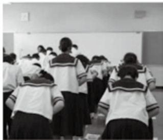
マナー講座のようす

今後は、卒業後の進路に向け、高校調べを行い、卒業生を招いての「先輩に学ぶ会」なども行う予定です。