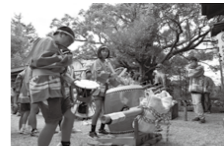
■大戸、西郷から子ども浮立を奉納