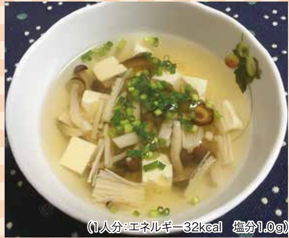
(1人分:エネルギー32kcal 塩分1.0g)

秋に旬を迎えるきのこですが、今では年中手に入る食材です。きのこは食物繊維を多く含んでいて、食物繊維は、便秘の予防、コレステロールの吸収を抑える、血糖値の急激な上昇を抑えるなどの働きがあります。