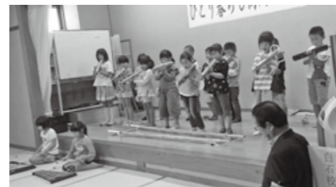
■北明小2年の児童による演奏

子どもたちは総勢152人の観客を前にして、緊張しながらも生き生きと発表ができていました。その後16人の児童が一人ずつに手作りのメッセージカードを渡し、参加者からお返しに、お礼