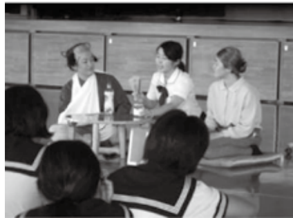
嬉野高校生によるUD基礎講座

今後は、その成果をまとめながら、実際に地域を見て回り、「誰もが住みやすい地域にするためにはどのようにしたらよいのだろう」ということを1年生なりに考えていきます。